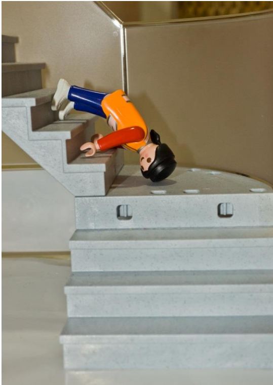
Fall 1: Sturz auf der Schulhaustreppe