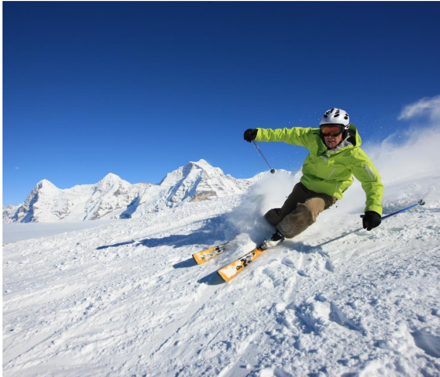
Fall 5: Skiunfall