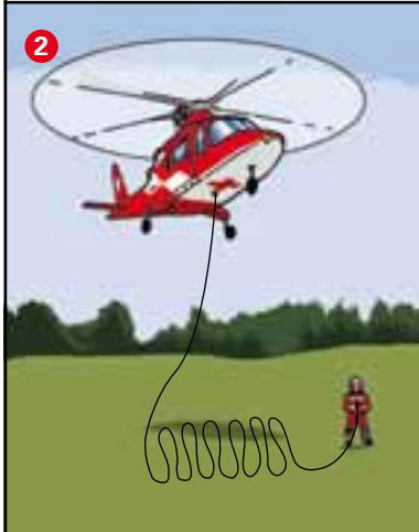
Der Helikopter startet und strafft das Seil, bis der Retter am Seilende abhebt.