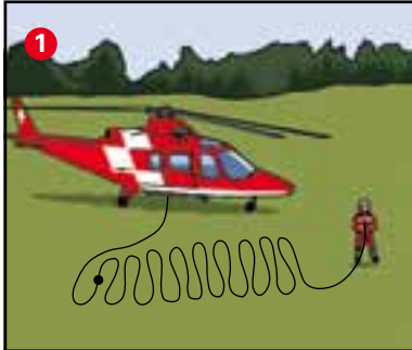
Das lange Seil ist am Lastenhaken des Helis befestigt und liegt säuberlich ausgelegt am Boden. Der SAC-Retter klinkt sich am Seilende ein.

Befindet sich ein Patient in einer hohen oder überhängenden Felswand, reicht die Rettungswinde von 90 Metern nicht mehr. In solchen Fällen hängt der SAC-Rettungsspezialist nicht an der Rettungswinde, sondern an einem fixen Seil am Lasthaken des Helis. Die Seillänge beträgt bis 220 Meter.